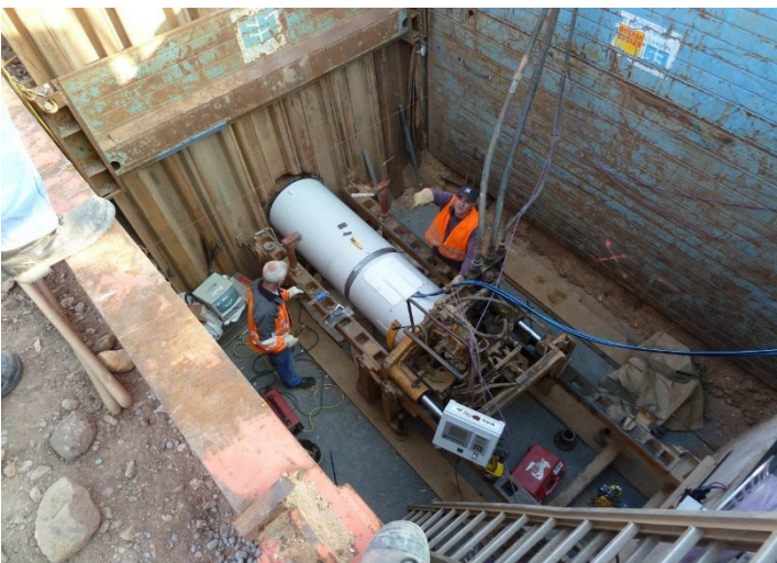
Flughafen Frankfurt Main: Gesteuerter Vortrieb Stahlbeton DN 400