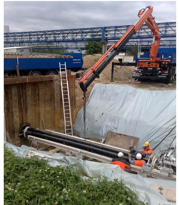
94447 Plattling - 36m Vortrieb von Stahlrohr DN 800 mit Einbau von 5 Rohren DN 200