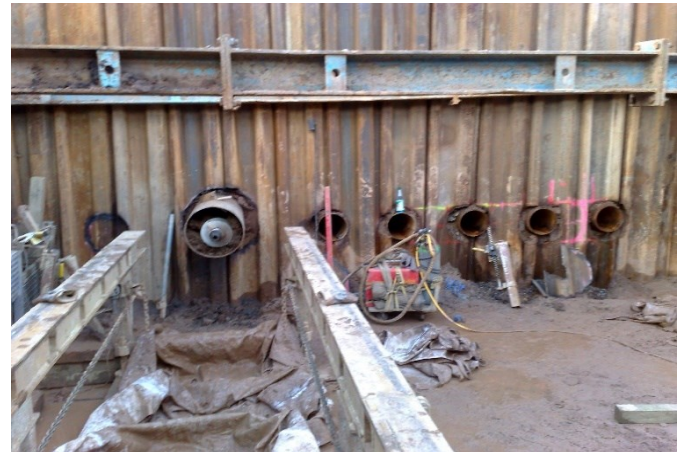
07580 Seelingstädt: Baustelle Wismut - 7 Bohrungen parallel aus einer Startgrube - Bohrlänge je 32m